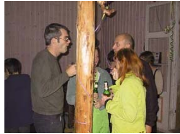
Höstmöte i Sunne